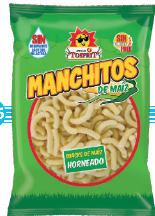
SNACKS DE MAÍZ HORNEADO SABOR KETCHUP / KETCHUP FLAVOURED BAKED CORN SNACKS 35 gr CÓDIGO ARANCELARIO / TARIFF CODE: 1103.20.00.00 CÓD. BOLSA/BAG CODE: 8422114130909 CÓD. CAJA/BOX CODE: 18422114130906 UDS POR CAJA /UNITS PER BOX: 25 CAJAS POR PALET/BOXES PER PALLET: 40