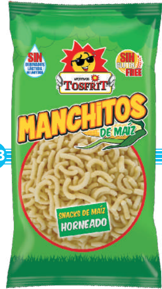
SNACKS DE MAÍZ HORNEADO SABOR KETCHUP / KETCHUP FLAVOURED BAKED CORN SNACKS 100 gr CÓDIGO ARANCELARIO / TARIFF CODE: 1103.20.00.00 CÓD. BOLSA/BAG CODE: 8422114131968 CÓD. CAJA/BOX CODE: 18422114131965 UDS POR CAJA /UNITS PER BOX: 9 CAJAS POR PALET/BOXES PER PALLET: 48