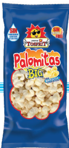
SNACKS DE MAÍZ HORNEADO / BAKED CORN SNACKS 100 gr CÓDIGO ARANCELARIO / TARIFF CODE: 1103.20.00.00 CÓD. BOLSA/BAG CODE: 8422114491963 CÓD. CAJA/BOX CODE: 18422114491960 UDS POR CAJA /UNITS PER BOX: 9 CAJAS POR PALET/BOXES PER PALLET: 48